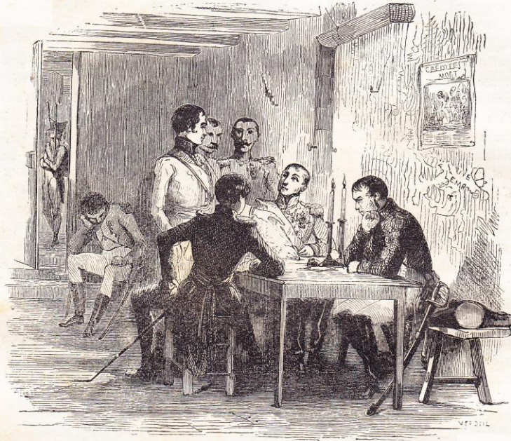
Là furent rédigés les principaux articles de la capitulation de Paris